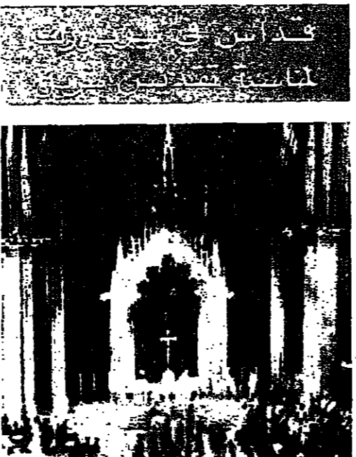
الشيخ خريش في كاتدرائية القديس بطرس في بيروت، بمناسبة اعلان البطريركي لثوابه، حضره سفير لبنان في واشنطن واركان السفارة وانباء الجالية اللبنانية.

أعلن بطريرك البطريرك الماروني مار انطونيوس بطرس خريش لدى عودته من روما امس، ان البابا يعمل لا يفتأ لبنيان لبنان والوطن التاجي والتعايش بين جميع طوائفنا. وقال خريش في بيان له: لقد كان لبنيان في صميم ما قمنا به من نشاطات واجريتها من محادثات سواء كان في باريس ام في روما. وقد اجتمعنا في باريس مع كبار المسؤولين وفي طليعتهم الرئيس جيمس كارول ديستان، وبعثنا بالبيعة على الصفحة ٤.